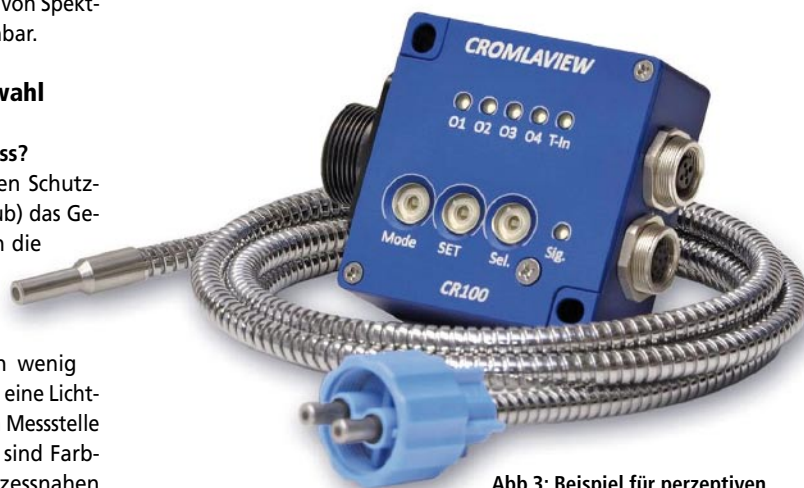
Abb.3: Beispiel für perzeptiven Farbsensor

Farbmaßzahlen sind beispielsweise bei der Qualitätsprüfung von lackierten Autoteilen sinnvoll, wenn die Produktion der Teile in verschiedenen Werken und an verschiedenen Standorten erfolgt. Hier sind Spektralfotometer mit hoher absoluter Genauigkeit erforderlich, um die hohen Qualitätsansprüche zu erfüllen.